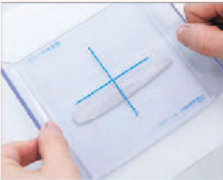
PHOTO GUIDE: N 12

Раскатайте 12г. глины в канатик при помощи минипреса и затем надавите на него чтобы получить расплюснутую форму заготовки